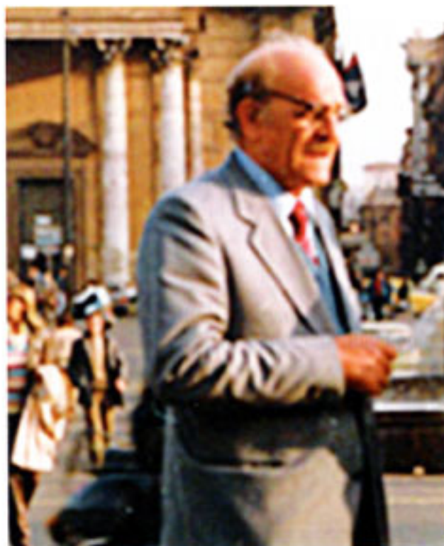
Venero Dominici in una rara foto scattata a Roma nel 1983

Venero Dominici (Messina 1923 – 2005) - Fotoreporter e operatore della Rai Tv tra i più prestigiosi artisti dell'obiettivo, ha testimoniato con le sue immagini mezzo secolo di storia siciliana e messinese in particolare. Esordì nel 1946 documentando l'opera di ricostruzione del dopoguerra. Memorabile la sua mostra allestita a Palazzo Zanca nel 50esimo anniversario del terremoto di Messina, attraverso il raffronto delle immagini del disastro con quelle della rinascita. Il suo gusto dell'inquadratura venne apprezzato anche all'estero con la "Mostra Messina Turistica" (di cui fu tra i promotori con Giuseppe Arbusi, altro storico fotoreporter). La rassegna, presentata in un ciclo di esposizioni estive dal 1956 al 1962 in Austria, Belgio, Danimarca, Germania, Gran Bretagna, Norvegia, Svezia e Svizzera produsse un vasto richiamo di turismo europeo verso Taormina, l'arcipelago eoliano e la Città dello Stretto.