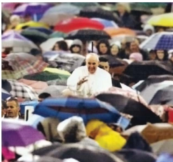
Foto del Papa tra la gente mentre piove

giornalista battagliero, predicatore dalla parola facile e convincente, ha saputo conciliare in un unico termine il binomio azione-contemplazione, mostrando la sua completezza di uomo spirituale, attivo ed instancabile, ma dotato di una intensa capacità contemplativa. Già nel marzo 1878, appena ordinato sacerdote, Padre Annibale ottiene il consenso dal suo Vescovo per stabilirsi nel