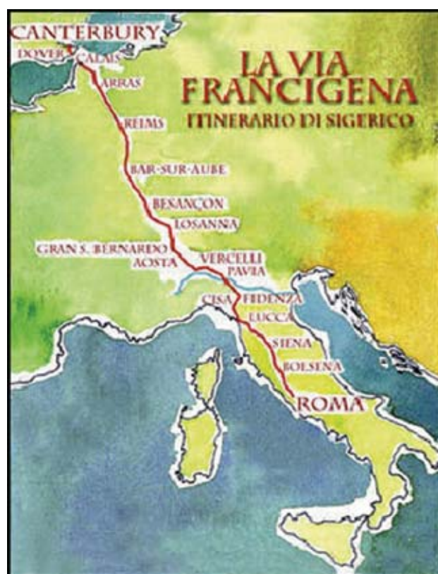
Cartina con il percorso della Via Francigena

L'iniziativa laziale, firmata a Formello, nella sede di Palazzo Chigi, è coincisa con la delibera del Campidoglio che ha concordato con le 7 municipalità romane interessate, un progetto comune per ridefinire il percorso della Via Francigena. Mille chilometri da percorrere in 50 giorni con 77 tappe. Per Lidia Ravera, assessore regionale alla cultura e alle politiche giovanili, la proclamazione del Giubileo è da considerare una felice concomitanza che vede l'amministrazione capitolina e i 17 comuni laziali della via Francigena del Nord, da tempo attivi su questo cammino,