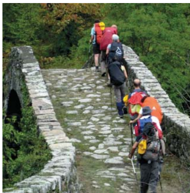
Caratteristico ponticello sulla via Francigena

Eterna aleggia sin d'ora l'atmosfera tipica che accompagnerà un soggiorno di fede e conoscenza, per vivere l'eccezionale Anno Santo alla scoperta delle quattro Basiliche Papali (San Pietro in Vaticano, San Giovanni in Laterano, San Paolo Fuori le Mura, Santa Maria Maggiore). ■